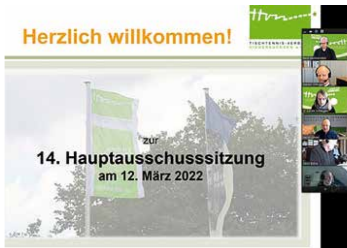
Rekordbeteiligung bei der 14. Hauptausschusssitzung.