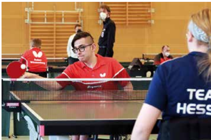
Beeindruckenden Sport bot die Jugend U25 bei den Deutschen Meisterschaften in Hannover.