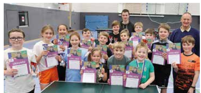
Strahlende Gesichter gab es bei den Jungen und Mädchen der mini-Meisterschaften des STV Barßel.