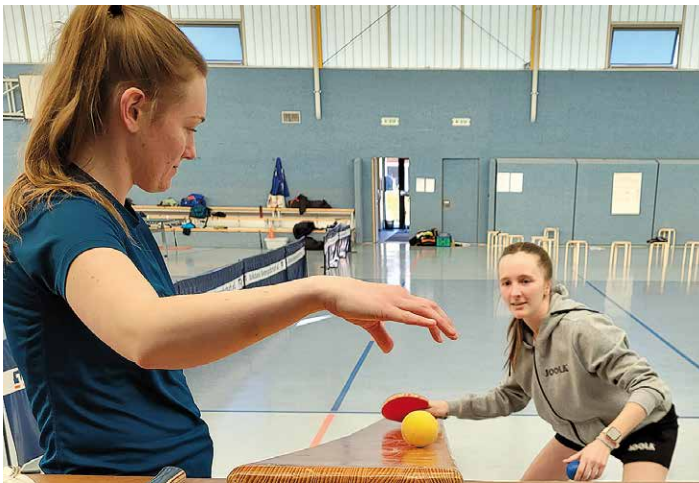
Technikerwerb ist ein Teil der STARTTER-Ausbildung. Hier zu sehen am Beispiel der beiden Teilnehmerinnen, die den Vorhand Topsin üben.