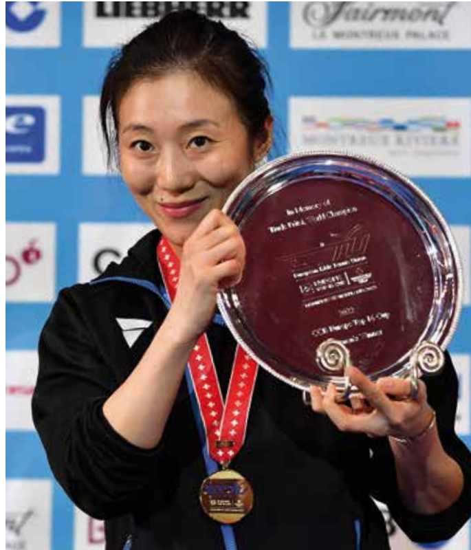
Nationalspielerin Han Ying, die für den polnischen Spitzclub Zamek Tarnobrzeg spielt, präsentiert sich mit Goldmedaille und Ehrenteller nach der Siegerehrung für den Gewinn des Europe Top 16 Cup.

Nach verwandeltem Matchball riss Han Ying freudestrahlend die Arme in die Luft. Denn für die 38-Jährige ist der