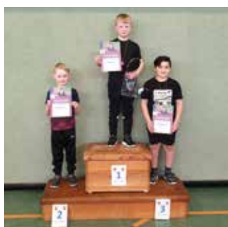
Der Sieger und die Platzierten AK III Jungen.