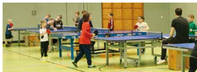
Mit großem Einsatz waren die Jungen und Mädchen bei der Sache.