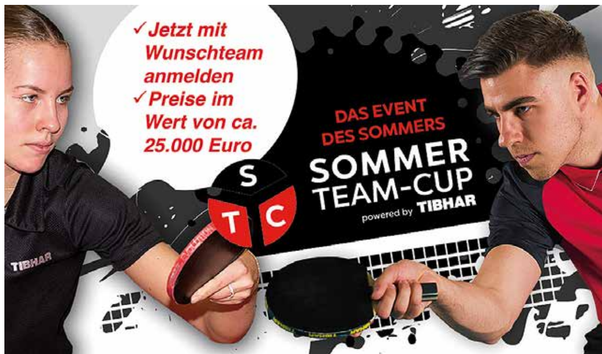
Auch in diesem Jahr gibt es wieder ein Alternativangebot für den Sommer.

Der MTV Soltau wird weitere Turnier durchführen und hofft auf mehr Race-Angebote aus dem Heidekreis. MTV Soltau