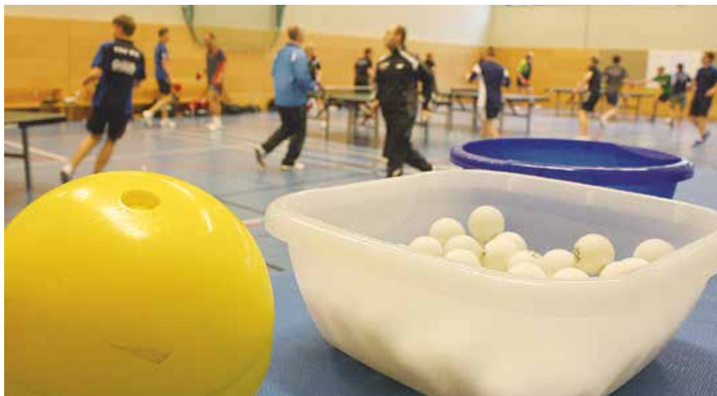
Im Rahmen des Programms „Förderung von Materialien zum Erhalt des Sportbetriebs“ können Antragsteller bis zu 750 Euro für Materialien gefördert bekommen.

Das Förderprogramm „Förderung von Materialien zum Erhalt des Sportbetriebs“ soll dabei helfen, dass Vereine ihr sportliches Angebot auch unter Pandemiebedingungen