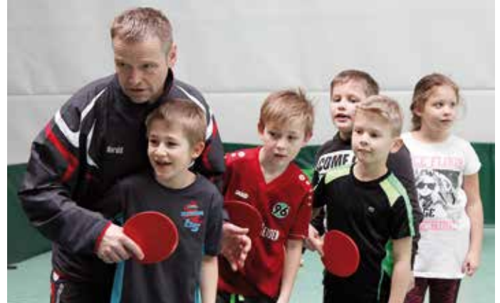
Die Trainer sorgten für erste Erfolgserlebnisse beim Spiel am Tisch.

Insbesondere war es mir wichtig, dass den Kindern die Freude an der Bewegung und der Spaß an den Vereinssportarten nähergebracht wird. Auch sollte die Zusammenarbeit mit der hiesigen Schule gestärkt werden. Etwa 300 begeisterte Kinder, die durch und durch zufriedenen Lehrer, die 16 motivierten Vereins Helfer sowie das positive Feedback legten für mich nahe, dass das Projekt mit seinen Zielen ein