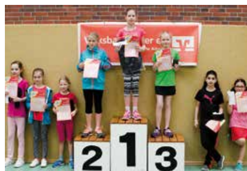
Sieger Mädchen (9 und 10 Jahre).