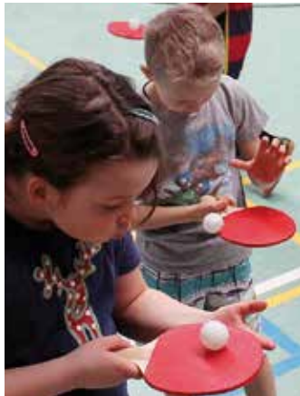
Viele Schüler hatten beim Projekttag zum ersten Mal Kontakt mit Ball und Schläger.

Motivieren, Werben, Begeistern. Zum ersten Mal gestaltete der TuS Jahn Lindhorst den Unterricht an der örtlichen Grundschule in Form eines