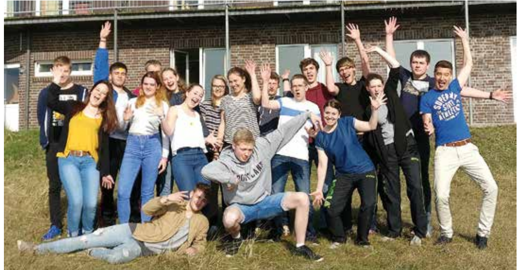
Gruppenfoto vor der Jugendherberge Wangerooze.

Mit einem neuen Ausbildungslehrgang zum sogenannten „Jugend Projektmanager“ möchte der TTVN jungen Menschen die Möglichkeit geben, sich in ihren Vereinen zu engagieren. Das Besondere der Ausbildungskonzeption: Neben zwei Lehrgangswochenenden und Onlinearbeit auf der Lernumgebung des TTVN ist vor allem die Durchführung eines realen Projekts im eigenen Verein zentraler Gegenstand der Ausbildung. Ein achtköpfiges Planungsteam, bestehend aus überwiegend jungen Dozenten des TTVN, konzipierte in insgesamt sechs Arbeitstreffen die Ausbildung.