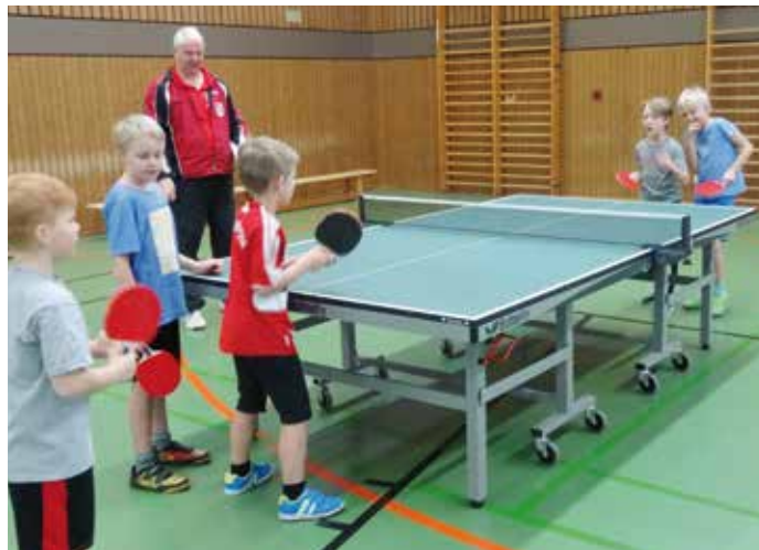
Beim RTC können Kinder erste Wettkampferfahrungen sammeln, dabei steht besonders der Teamgedanke im Vordergrund.

Drei Wochen nach dem Rundlauf-Team-Cup nahmen rund 50 Kinder des 1. und 2. Schuljahres der Janusz-Korczak-Schule