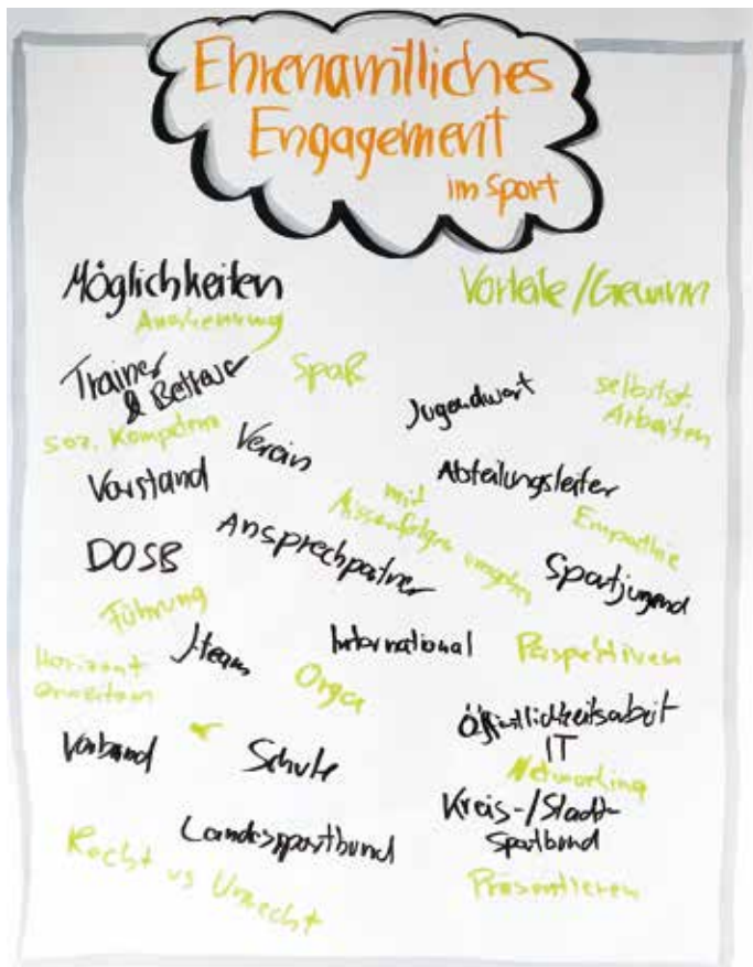
Motive für ehrenamtliches Engagement im Sport.

Die Ausbildung startete mit einer Onlinephase, in der sich die Teilnehmer auf der edubreak® Lernumgebung des TTVN mit einem kleinen Video vorstellten und ihren Verein beschrieben. Im ersten Lehrgangabschnitt vom 21. bis 23. Oktober 2016 in Hannover standen Themen zum Projektmanagement und Überlegungen zu möglichen Vereinsprojekten im Mittelpunkt. Das konkrete Projekt legten die Teilnehmer erst in der folgenden Onlinephase verbindlich fest. Schließlich musste mit dem Abteilungsvorstand und den Unterstützern Rücksprache gehalten werden. Anschließend begann die Projektphase, mit der Umsetzung im Verein. In dieser Zeit dokumentierten die Teilnehmer auf der Ler-