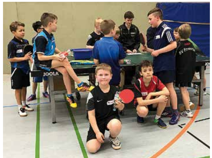
34 Kinder nahmen an der zweiten Stufe der niedersächsischen Talentsichtung in Osnabrück teil.

Die besten 15 Spieler und Spielerinnen können sich auf eine Einladung zur dritten Stufe der TTVN-Nachwuchssichtung freuen. Diese findet als Wochenendlehrgang vom 6. bis 7. Mai 2017 in Osnabrück zusammen mit dem aktuellen D1-Kader statt. Ann-Katrin Thömen/ Oliver Stämmler