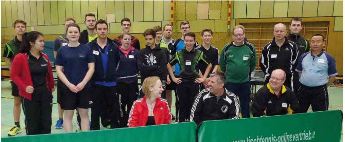
In Peine wurden 20 neue Basis-Co Trainer ausgebildet.