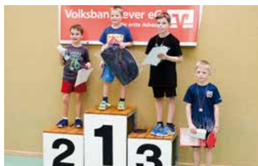
Sieger Jungen (8 Jahre und jünger).