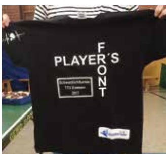
Jeder Spieler erhielt für das Turnier ein eigenes T-Shirt, dessen Schrift unter Schwarzlicht leuchtet.

Dafür haben wir am Freitag, 10. März 2017, ein Turnier organisiert, an dem 18 Kinder und Jugendliche sowie 14 Erwachsene teilgenommen haben. Zuerst spielten die Kinder circa zwei Stunden, und im Anschluss folgten die Erwachsenen, bei denen wir das Turnier selbst nochmal aus Sicht der Spieler miterleben durften. Für dieses Projekt haben wir ein „Black-TT Team“ organisiert, welches alle Materialien mitgebracht und die Turnierleitung für uns