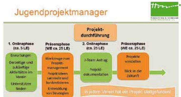
Aufbau und Ablauf der Pilotausbildung zum Jugend Projektmanager.