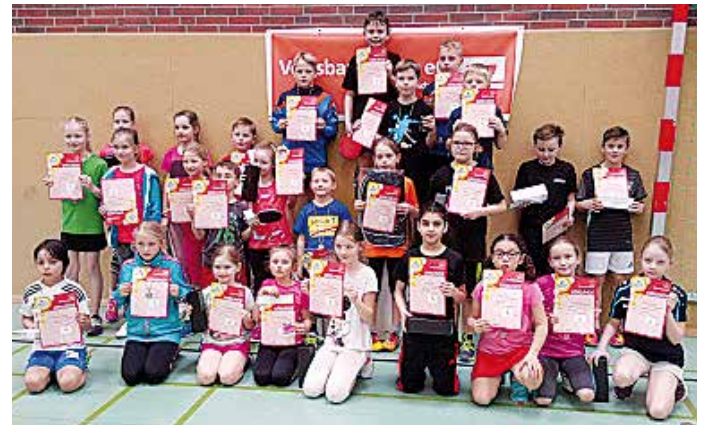
Alle Sieger und Platzierten des mini-Kreisentscheides.

schon bei den Punktspielen ein. Der Vareler TB hat dies in dieser Saison auch mit Erfolg gemacht“, erläuterte er positive Beispiele. „Nur wenn die Betreuer Zeit und Kraft in diese Aktion setzen, wird es weiterhin eine positive Entwicklung im Bereich der Jugend geben“, fügte er weiter an. Kreisvorsitzender Günther Schäfer (Sanderbusch) bedankte sich bei den Verantwortlichen der Vereine der Orte Jever, Sande, Horsten, Cleverns, Sillenstede, Roffhausen, Varel, Obenstrolche, Spohle und Heidmühle, die Ortsentscheide durchgeführt haben, hob aber die Ausnahmestellung des MTV Jever, der erneut mit vielen Helfern die Ausrichtung des vierstündigen Kreisentscheides übernommen hat, hervor. Erfreulich, dass 29