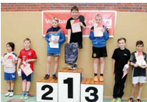
Sieger Jungen (9 und 10 Jahre).