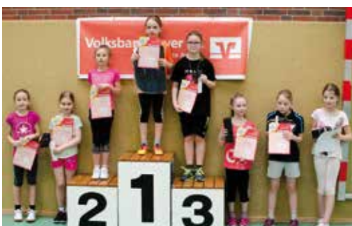
Sieger Mädchen (8 Jahre und jünger).