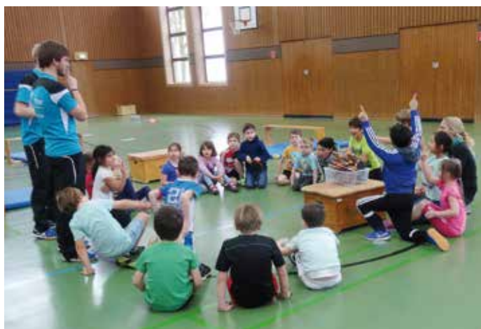
Die beiden FSJ'ler des Tischtennis-Regionsverbandes Süd-niedersachsen haben den Kindern der Janusz-Korczak-Schule einen Schnupperparcours aufgebaut, damit Sie an den Tischtennis-Sport herangeführt werden können.