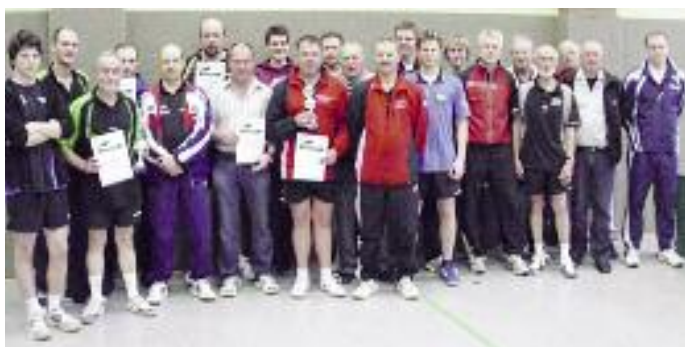
Alle Teilnehmer der Kreispokalendrunde in Herzberg.