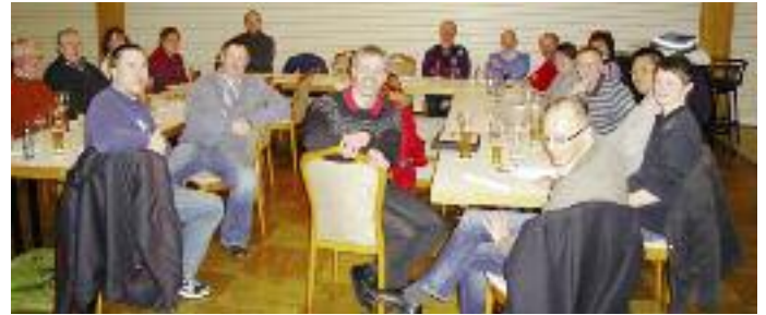
Drei Stunden lang tauschten sich Vertreter der Weser-Ems-Kreise und des Bezirksverbandes aus und diskutierten intensiv über neue Wege bei der Jugendförderung.

auch gar nicht. Die Finanzierungsmodelle sind je nach regionalen Möglichkeiten unterschiedlich. Die meisten kommen nicht ohne einen Teilnehmerbeitrag aus (genau wie die Bezirksstützpunkte), andere haben eine zweckgebundene Vereinsumlage für alle Kreisvereine, wiederum andere mixen diese Möglichkeiten oder können Ko-Finanzierungen durch den jeweiligen Kreissportbund erhalten. Einig waren sich die Teilnehmer, dass dort, wo es „weiße Talentförderungsflecken“ gibt, der Bezirk Hilfestellung gewähren sollte – ein Ansinnen, dem dieser positiv gegenübersteht.