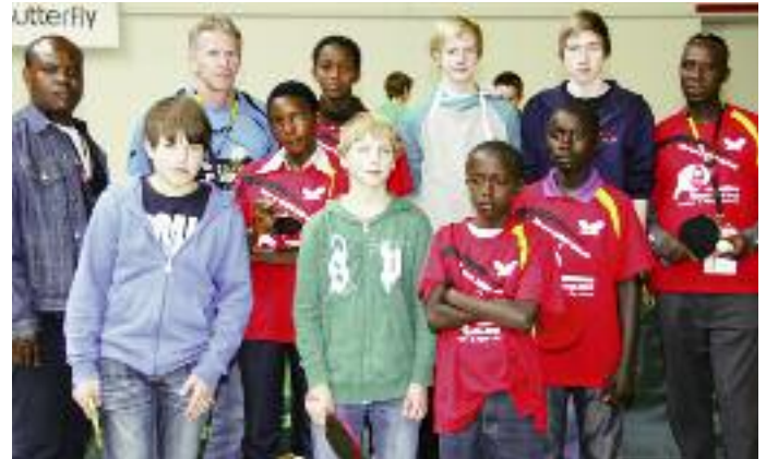
Nach den sportlichen Aktivitäten noch ein Erinnerungsfoto – dann trennten sich wieder die Wege der Lohner und Dinklager von den Gästen aus Burundi.