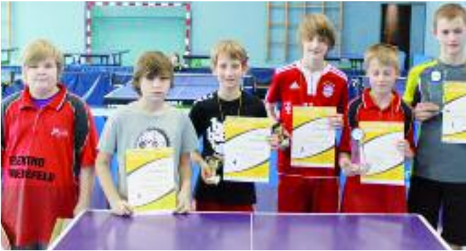
Sieger und Platzierte bei den Jungen der Altersklasse 11/12.

durch. Diese sechs Aktiven werden den Kreis Celle beim Bezirksentscheid am 22. April in Elsdorf vertreten.