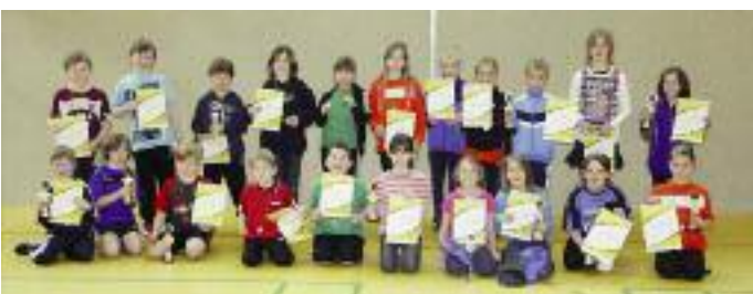
Pokale, Urkunden und Sachpreise gab es für die Sieger im mini-Kreisentscheid in Bad Münden.