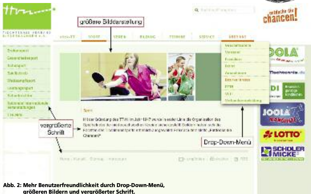
Abb. 2: Mehr Benutzerfreundlichkeit durch Drop-Down-Menü, größeren Bildern und vergrößerter Schrift.

Haben Sie Anregungen zur Homepage oder eine Unstimmigkeit entdeckt? Bitte kontaktieren Sie uns einfach per E-Mail unter rammenstein@ttvn.de oder telefonisch unter 0511/98194 – 16. Wir wünschen Ihnen viel Spaß beim „Surfen“ auf www.ttvn.de.