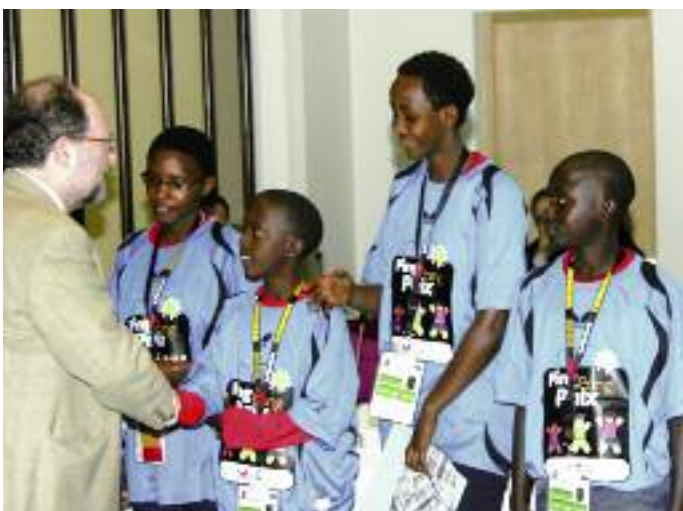
ITTF-Weltpräsident Adham Sharara begrüßt die Gäste aus Burundi per Handschlag.