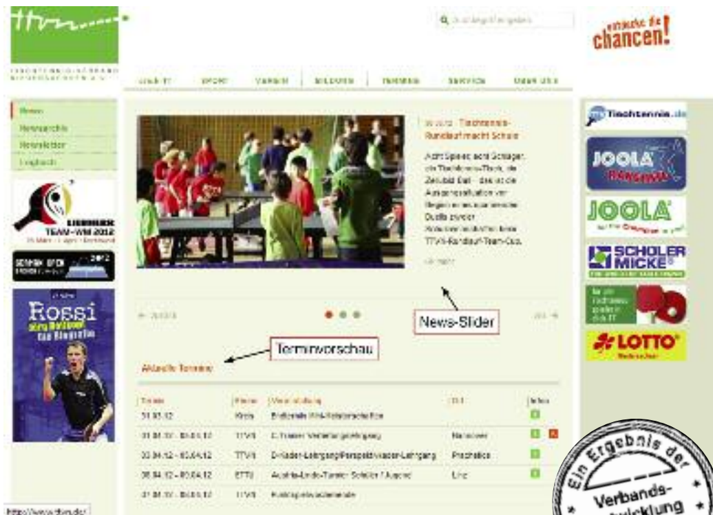
Abb.1: Die Startseite präsentiert sich mit News-Slider und Terminvorschau.

Die vorgenommenen Änderungen sind bereits auf der Startseite sichtbar. Größere Bilder, eine aktuelle Terminvorschau sowie ein News-Slider mit jeweils drei Kurznachrichten (rotierende News) präsentieren sich dem User direkt nach Aufruf der TTVN-Homepage (siehe Abbildung 1). Ältere News stehen auch weiterhin nach Monaten sortiert im Newsarchiv zur Verfügung. Herzstück des Relaunch ist das neue „Drop-Down-Menü“ in der horizontalen Hauptnavigation (siehe Abbildung 2). Dieses ermöglicht dem Anwender nun einen schnelleren Zugriff auf die gewünschten Unterseiten. Nervige „Zusatzklicks“ werden so vermieden. Die Einstiegsseiten der Rubriken warten mit neuen und vergrößerten Bildern auf. Eine augenfreundlichere Schriftgröße sowie eine übersichtlichere Seitengestaltung kommen dem User entgegen. R.Rammenstein