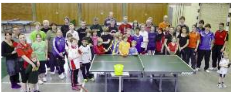
Ob jung oder alt – beim Familienturnier des TSV sind alle mit Spaß dabei.

Nähere Informationen zur neuen Rubrik im ttm sowie die bereits veröffentlichten Berichte finden Sie auf unserer Homepage www.ttvn.de unter der Rubrik Verein/Mein Verein. Machen Sie mit, wir freuen uns auf Ihre Beiträge!! Ihr Ansprechpartner im TTVN: René Rammenstein, Telefon 0511/98194-16.