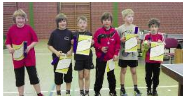
Das sind die platzierten Jungen in der Konkurrenz bis zu 10 Jahren.