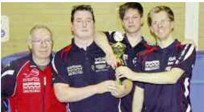
Blau-Weiß Borssum II konnte seiner Favoritenrolle gerecht werden und den FC Loquard II mit 5:2-Punkten bezwingen.

Zeitsprung: Im Vorfeld der Europameisterschaft 2000 in Bremen überlegten die Verantwortlichen in Frankfurt, wie sie diese Titelkämpfe einem breiteren Publikum präsentieren könnten. Prompt wurde die Lohner Idee hervorgeholt – mit dem Vorschlag, die Malaktion bundesweit durchzuführen. Dass es letztlich dazu kam, war dem Dortmunder Wilfried Micke zu verdanken, der sofort begeistert war und Bälle zur Verfügung stellte. Mit der Resonanz hatte er genauso wenig gerechnet wie die Lohner im Jahr 1993.