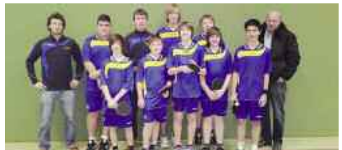
Strahlende Gesichter beim gesamten Team des Werner-von-Siemens-Gymnasiums.

Mit dem Titelgewinn qualifizierte sich die Mannschaft zugleich für den Landesentscheid, in Wathlingen (Landkreis Celle).