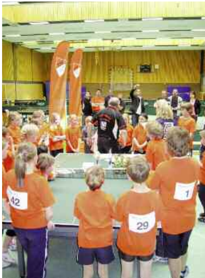
Großer Andrang herrschte beim Kreisentscheid der mini-Meisterschaften von Schaumburg.

Seit 1969 wird dieser Wettbewerb in den Ländern der Bundesrepublik durchgeführt. Er wird getragen von der Deutschen Schulsportstiftung und steht allen Schulen in Deutsch-