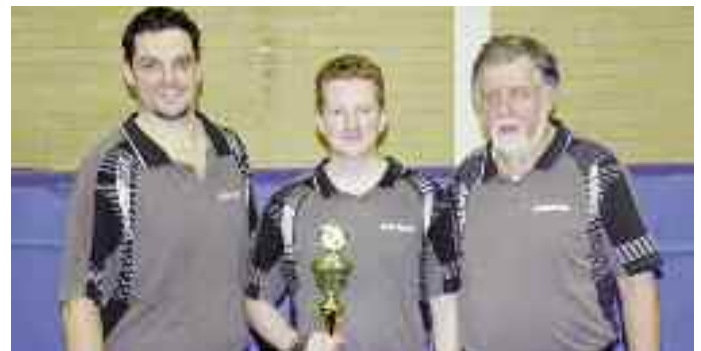
Die Sportfreunde Larrelt konnten beim „Heimspiel“ überzeugen und den Pokalsieg bejubeln.