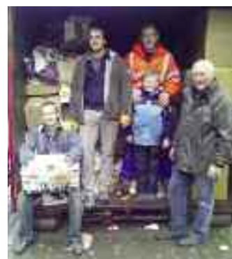
Der TTC im Wochenendeinsatz bei der Altpapiersammlung.

Neben dem Themenfeld Jugendarbeit hat der TTC Haßbergen seit Anfang des Jahres 2012 den Fokus auf einen weiteren interessanten Bereich gesetzt: den „Gesundheitssport“. Ab April 2012 wird ein gesundheitsorientiertes Herz-Kreislauftraining mit Tischtennis angeboten. Die Freude war demzufolge groß, als der Verein mit seiner lizenzierten P-Trainerin zum 1. Januar das Qualitätssiegel „SPORT PRO GESUNDHEIT“ erhielt. Das Siegel wird vom Deutschen Olympischen Sportbund in Zusammenarbeit mit der Bundesärztekammer für