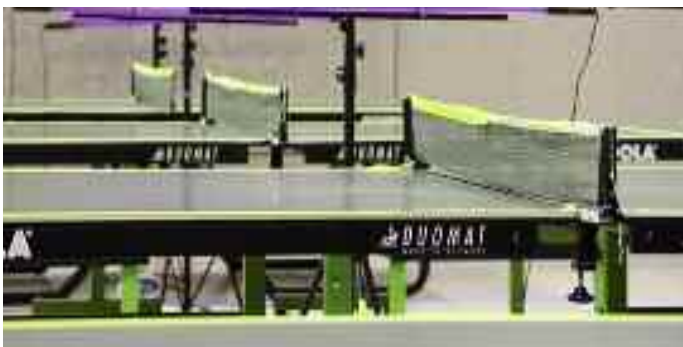
Die Tischkanten, Netze und Schläger wurden mit einem fluoreszierenden Band beklebt. Schwarzlicht-Leuchtstoffröhren sorgten für die nötige Atmosphäre.