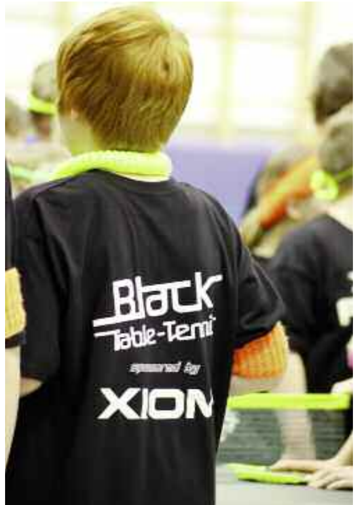
In der Teilnahmegebühr von nur 19,50 Euro war ein speziell präpariertes T-Shirt enthalten.