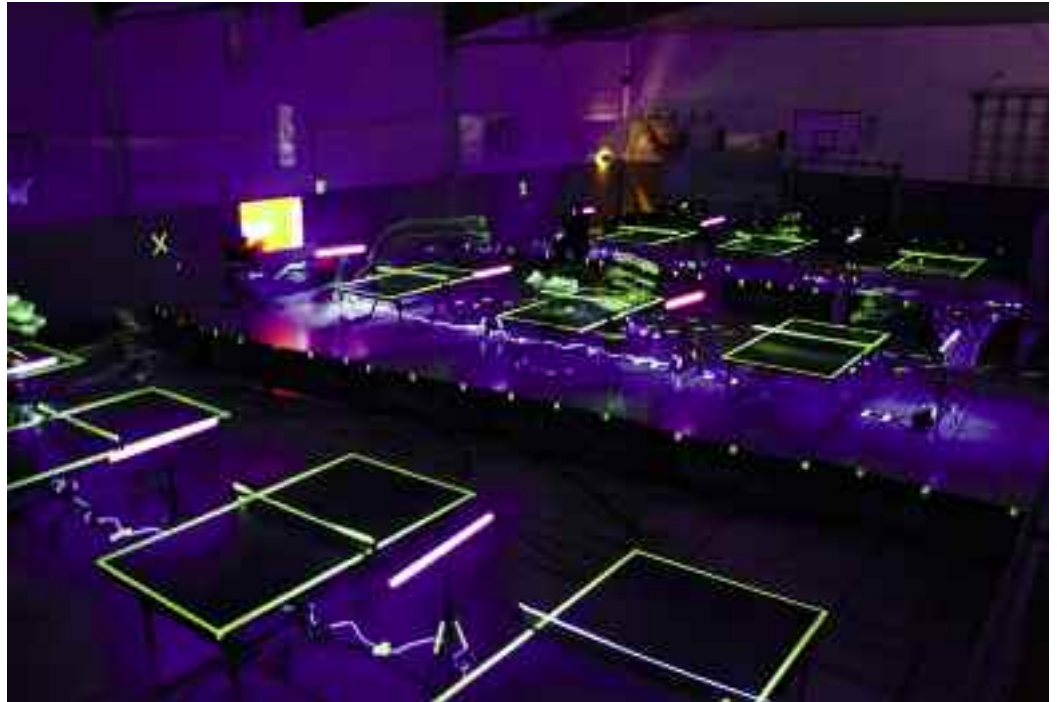
Szenen wie aus einem Science-Fiction-Film.

Das Event wurde in Zusammenarbeit mit dem Frankfurter Unternehmen Black-TT umgesetzt, welches die Ausrüstung sowie die Turnierleitung stellte. So lieferten die speziell präparierten Tischkanten, Netze, Schläger und T-Shirts der Teilnehmer den angereisten Zuschauern im Schein der Schwarzlicht-Leuchtstoffröhren ein beeindruckendes surrealisti-