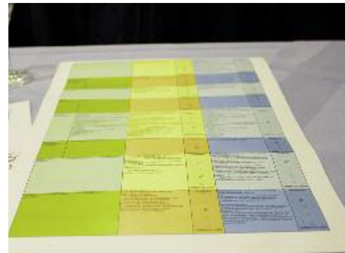
Ein umfassender Fragebogen informierte die Teilnehmer über die Vorschläge – zu jedem Teilbereich konnte ein Meinungsbild abgegeben werden.