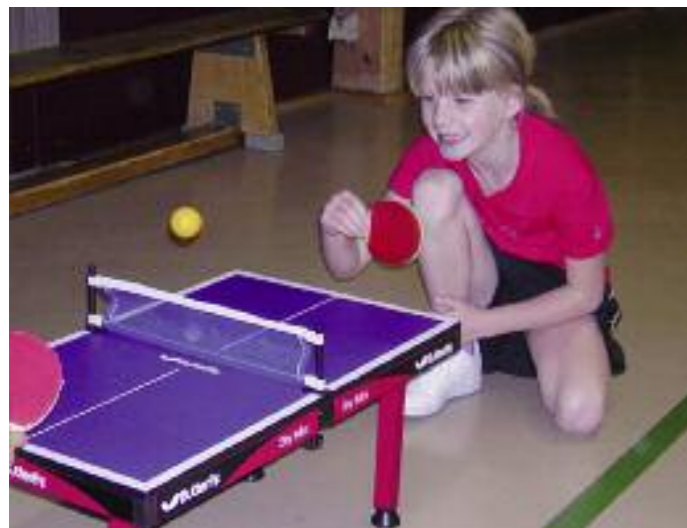
Das Spielen am Mini-Tisch machte den Grundschülerinnen viel Spaß.