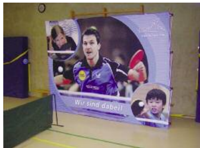
Wer ein Großer werden will wie Timo Boll, sollte im Grundschulalter bereits mit dem Tischtennissport beginnen.