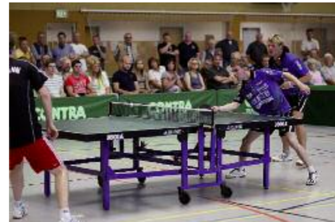
Eine spannende Begegnung erlebten rund 140 Besucher. Am Ende musste der TuS Celle 92 eine 6:9-Niederlage gegen den Hamburger SV hinnehmen.