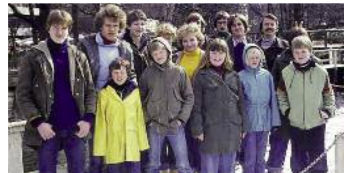
Die Teilnehmer der Malentefahrt aus dem Jahr 1979.