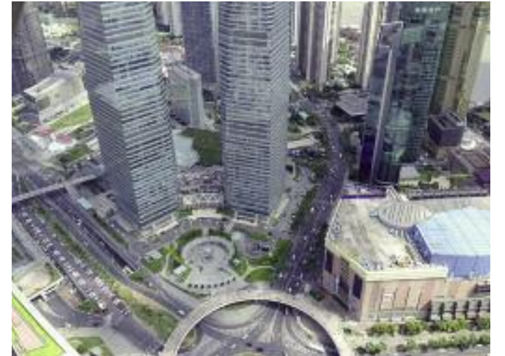
Der Oriental Pearl TV Tower ist der dritthöchste Fernsehturm Asiens und bietet mit seiner Höhe von 468 Metern eine fantastische Aussicht auf Shanghai.