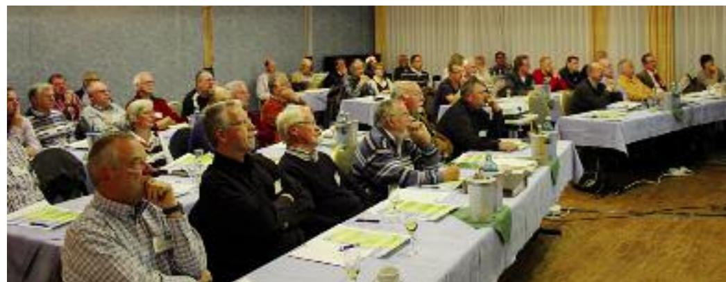
Rund 50 Teilnehmer verfolgten gespannt die Vorschläge zur neuen Regional- und Gremienstruktur und diskutierten die Folgen für die Kreisverbände.