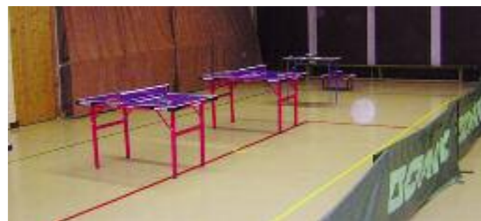
Aufgebaut sind die Midi-Tische – das TT-Schnuppern kann beginnen.