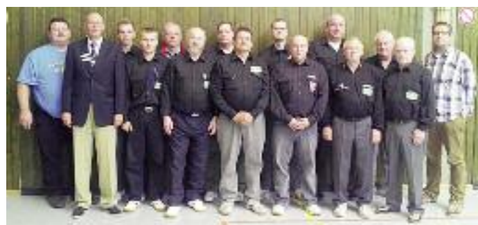
Alle Teilnehmer der VSR-Ausbildung.