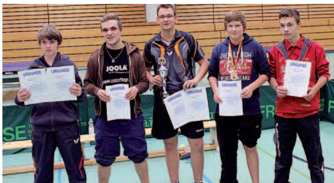
Bei den Jungen landeten die Nachwuchstalente des MTV Jever und des Heidmühler FC auf den vorderen Plätzen. Beide Teams treffen in dieser Saison auch in der Niedersachsenliga aufeinander..