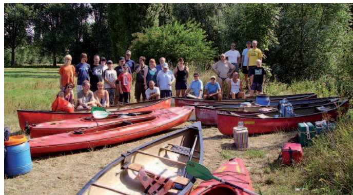
Ausflüge, wie die Paddeltour auf der Ilmenau, fördern die Geselligkeit der Abteilung.

Gründung: 1920 Mitgliederzahl: 657 (davon 72 in der Abteilung Tischtennis) Mannschaften: 9 Vereinsfarben: Gelb-Schwarz Homepage: www.tsv-wrestedt-stederdorf.de