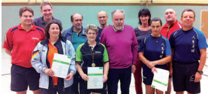
Sieger und Platzierte der Senioren-Kreismeisterschaften.