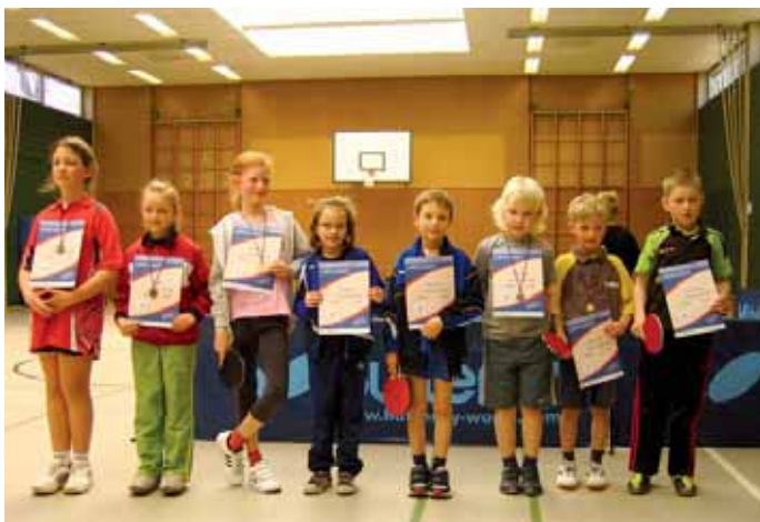
Die Sieger der Altersklasse III.