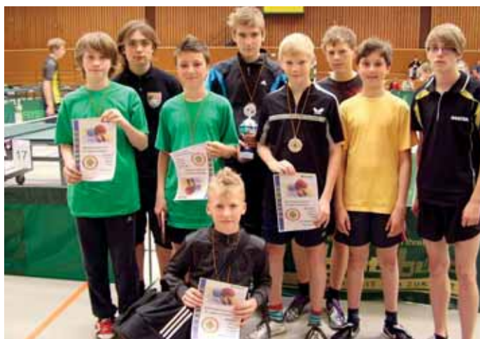
Bei den Schülern A waren diese Nachwuchstalente erfolgreich.