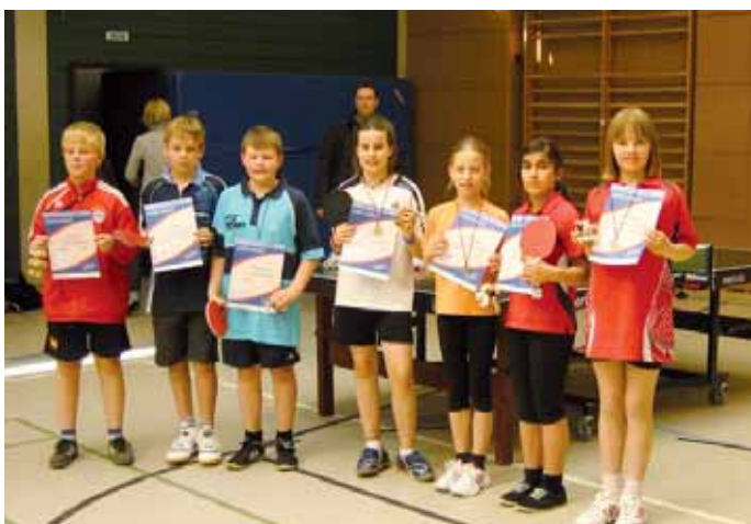
Die Sieger der Altersklasse II.

Ausgestattet mit einem kleinen Erinnerungspräsent reisten die Teilnehmer nach Hause zurück. Die Teilnehmer des Halbfinals wurden mit Medaillen und Urkunden geehrt und haben sich die Startberechtigung für den Landesentscheid in Wolfsburg erspielt. Die Verantwortlichen des Bezirksverbandes wünschen allen Teilnehmern viel Erfolg! Jörg Berge