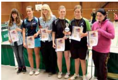
12 Punkte für Ostfriesland – die besten Mädchen des Grand Prix.

Wie immer besonders spannend beim Grand Prix in Wiesmoor waren nicht nur die Ausspielungen der Tagessieger,