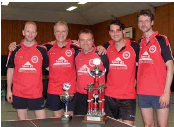
Der MTV Embsen setzte sich bei den Herren durch.

Bei den Damen siegte die Mannschaft von Dahlenburger SK II.