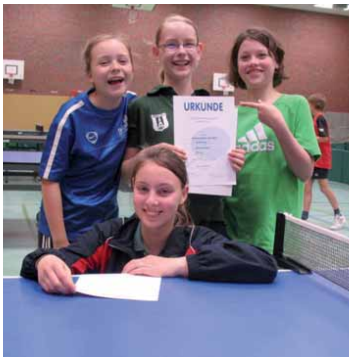
Die Schülerinnen freuten sich über ihren Erfolg bei der Jugendrangliste.