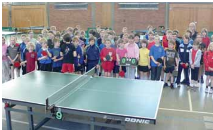
Über optimale Bedingungen freuten sich die Teilnehmer des mini-Bezirksentscheids in Reislungen.