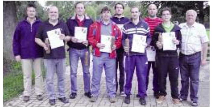
Alle Sieger nach der Ehrung.