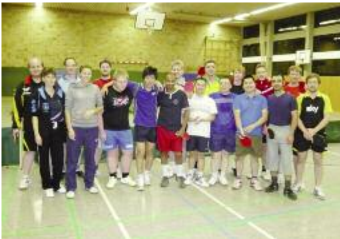
Stets gute Laune herrschte bei den Aktiven in der Sporthalle der Robert-Koch-Schule in Clausthal.