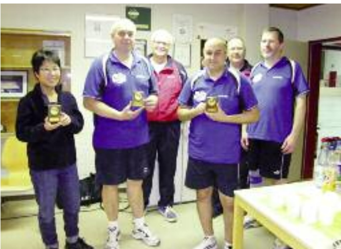
Die Hobbyspieler des TTC Freizeit OHZ spielten auch beim Jubiläumsturnier stark auf und freuten sich über die Pokale.

weiter. So befasst sich eine Projektgruppe mit dem Bereich Breitensport. Bekannt ist, dass 600 000 Spieler in der Bundesrepublik organisiert sind, doch acht Millionen greifen in Deutschland gelegentlich zum Schläger. Wie kann man diesen Personenkreis erreichen? Sialino sagte: „Hier gilt es, Freizeitkonzepte zu erarbeiten und Trendsport anzubieten.“ Ein Beispiel ist hier Headis (Kopfballschläger), wo man in Tur-