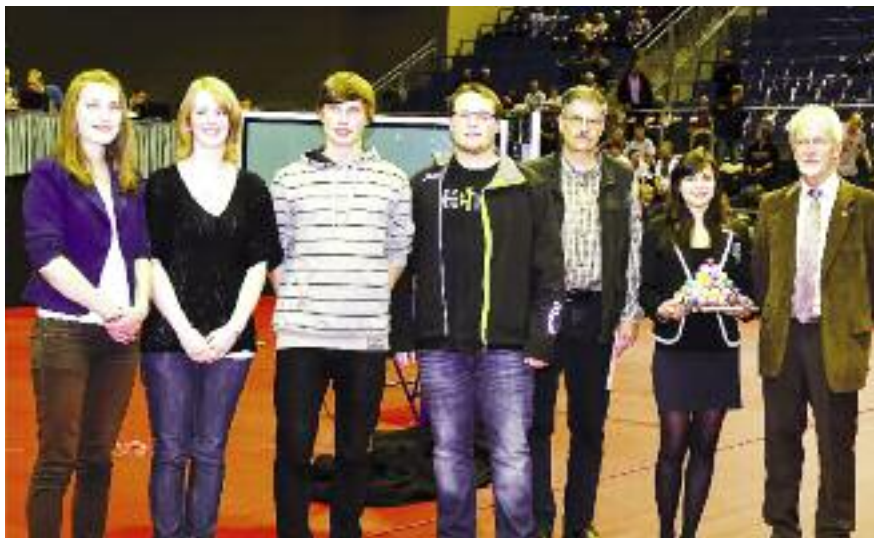
Freude bei Mitgliedern des TSV Rünigen. Die Tischtennisabteilung wurde im Rahmen des World Team Cups in Magdeburg mit dem Breitensportpreis ausgezeichnet.

Am 5. November wurde während des World Team Cups in der Getec Arena in Magdeburg vor 2900 Zuschauern an einen der sechs Gewinnervereine der Breitensportpreis verliehen.