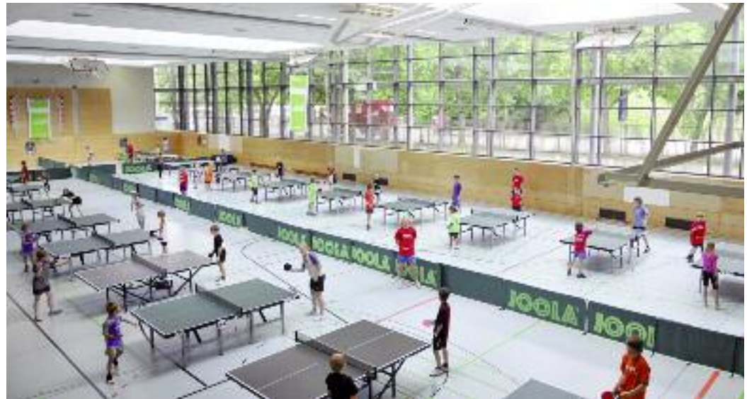
Seit 2010 wird die landesweite TTVN-Talentsichtung in drei Stufen durchgeführt.

Bezirk Braunschweig – Ort: Carl-Strüber-Sporthalle, Sandweg, 38434 Bilshausen. Zeit: Sonntag, 22. Januar 2012 , von 10.30 – 17.30 Uhr. Anreise