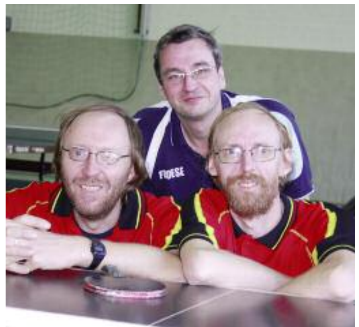
Erneut bis ins Finale vordringen konnte der MTV Jever – trotz der knappen Niederlage war die Stimmung beim „Tag der Hobbyspieler“ prächtig.