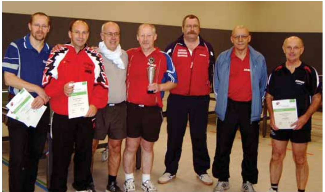
► Die Sieger und Platzierten bei den Senioren.

Die Vereinswertung der Senioren, Platzierungspunkte für die Plätze eins bis drei, konnte erstmals der Oldenbrocker TV (9,5