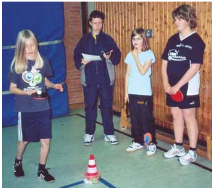
Teilnehmer an einer Station