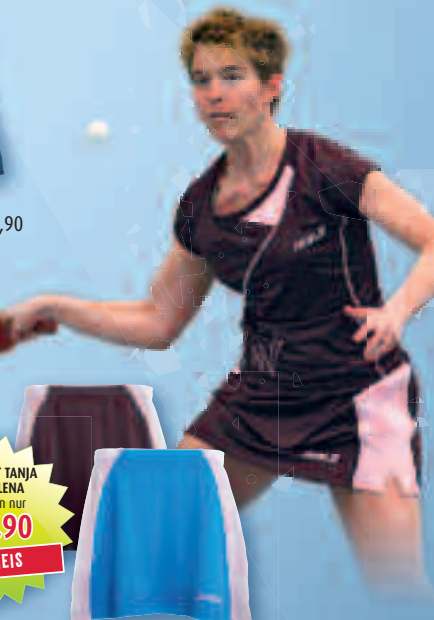
ROCK LENA | XXS - XL | € 29,90

Alle Preise sind unverbindlich empfohlene Verkaufspreise.