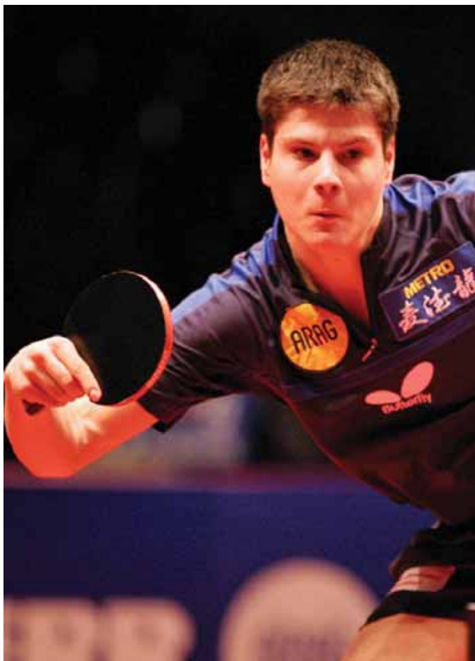
► Dimitrij Ovtcharov

Karten für diesen Toperevent gibt es ab sofort unter der Telefonnummer 01805-878080 (14 ct./Min, aus dem Handynetz ggf. abweichend) oder im Internet unter www.tui-arena.de und bei eventim.