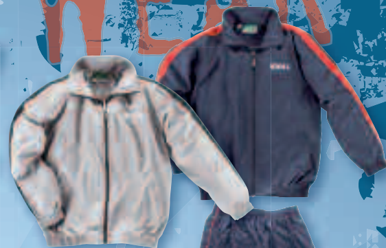
ANZUG SQUADRA | XXS - XXXL | € 36,90