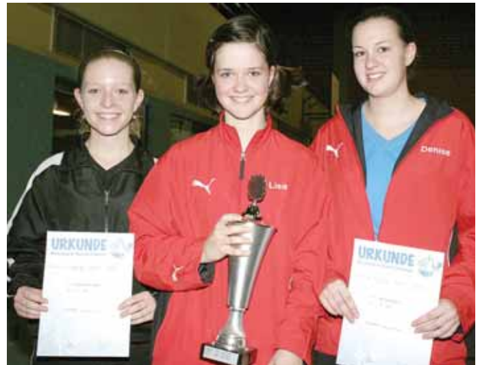
► Sieger bei den Mädchen.