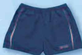
SHORT SINUS | XXS - XXXL | € 22,90