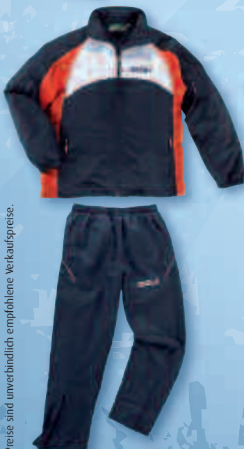
ANZUG PERU | XXS - XXXL | € 59,90