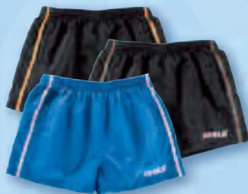
SHORT CHAT | XXS - XXXL | € 19,90