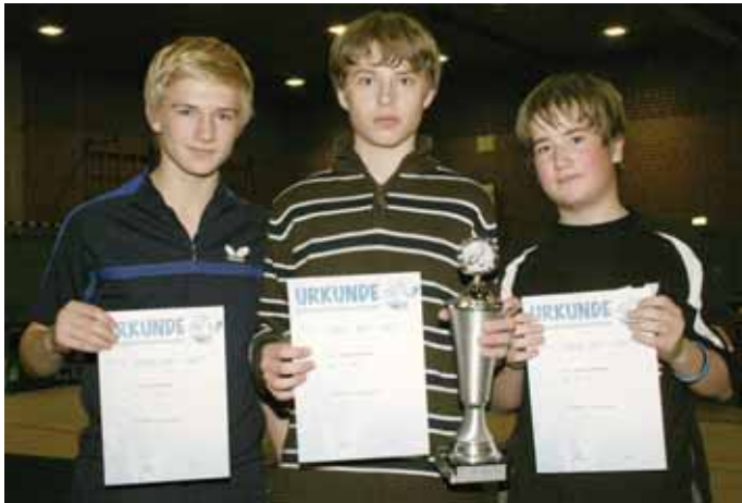
► Sieger bei den Jungen.