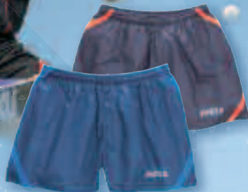
SHORT SUN | XXS - XXXL | € 22,90