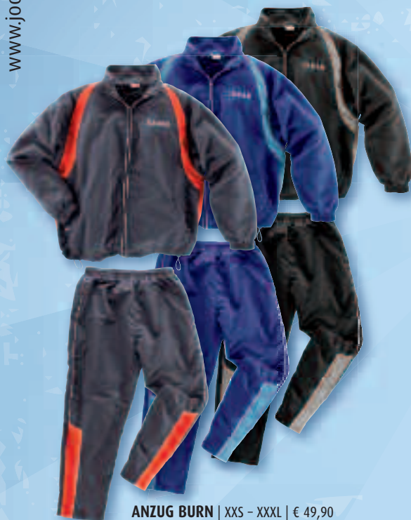
ANZUG BURN | XXS - XXXL | € 49,90